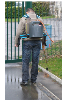
Désherbeur thermique porté